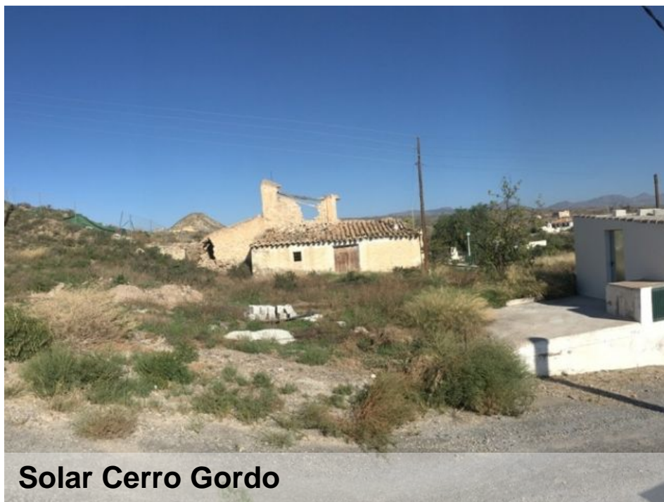
Solar Cerro Gordo